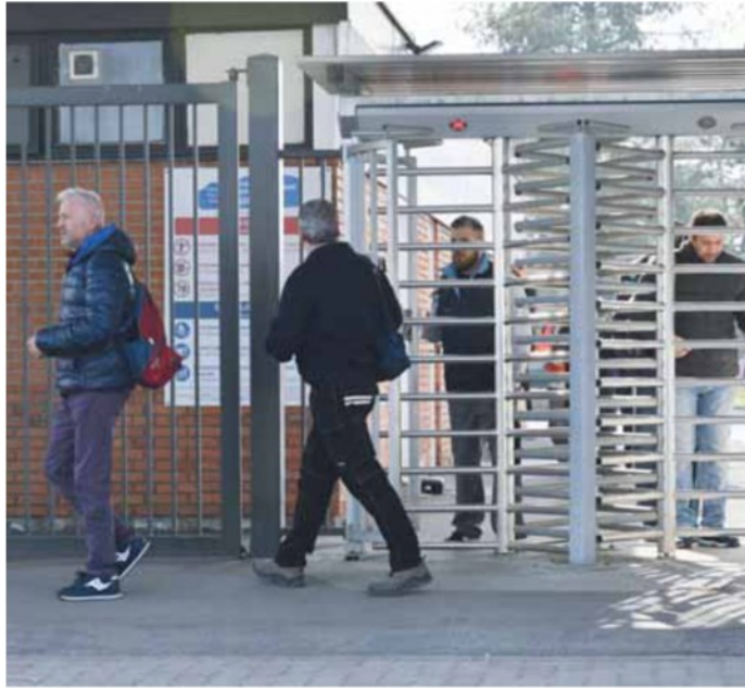
• Operai all'uscita di una fabbrica