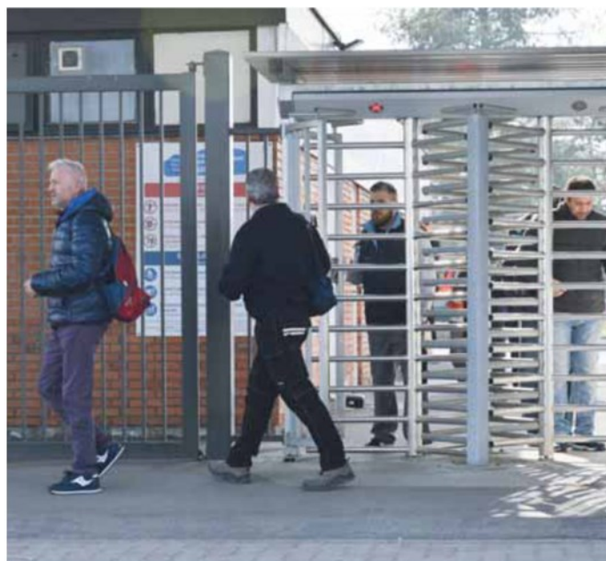
• Operai all'uscita di una fabbrica