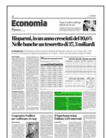
Superficie 4 %

ARTICOLO NON CEDIBILE AD ALTRI AD USO ESCLUSIVO DEL CLIENTE CHE LO RICEVE - 6640