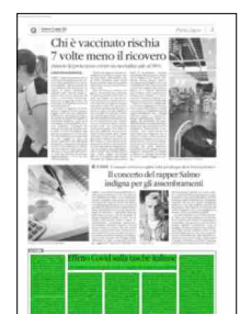
Superficie 16 %

ARTICOLO NON CEDIBILE AD ALTRI AD USO ESCLUSIVO DEL CLIENTE CHE LO RICEVE - 6640