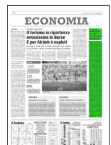
Superficie 9 %

ARTICOLO NON CEDIBILE AD ALTRI AD USO ESCLUSIVO DEL CLIENTE CHE LO RICEVE - 6640