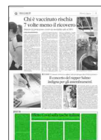
Superficie 16 %

ARTICOLO NON CEDIBILE AD ALTRI AD USO ESCLUSIVO DEL CLIENTE CHE LO RICEVE - 6640