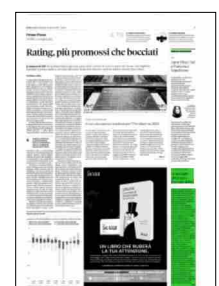
Superficie 7 %

ARTICOLO NON CEDIBILE AD ALTRI AD USO ESCLUSIVO DEL CLIENTE CHE LO RICEVE - 6640