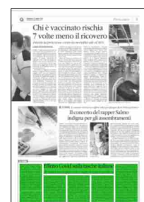
Superficie 16 %

ARTICOLO NON CEDIBILE AD ALTRI AD USO ESCLUSIVO DEL CLIENTE CHE LO RICEVE - 6640