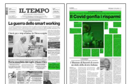
Superficie 58 %

mento delle rate dei prestiti alle famiglie: le sofferenze, infatti, sono calate del 15,1% (meno 2 miliardi), arrivando, complessivamente, a 11,6 miliardi; nel 2016 il totale si attestava a 37,5 miliardi e in cinque anni si è registrato un calo del 69,1% (meno 25,9 miliardi). «L'incertezza del presente e la sfiducia nel prossimo futuro hanno aumentato la tendenza al risparmio, riducendo la propensione delle famiglie a indebitarsi per comprare casa. Sul comportamento negli ultimi 12 mesi, quelli caratterizzati dal Covid, hanno pesato la paura per il futuro e, ovviamente, anche tutte le restrizioni legate all'emergenza sanitaria che hanno limitato tantissimo i consumi e condizionato il turismo, la ristorazione, la grande distribuzione e il commercio al dettaglio. Per uscire definitivamente da questa situazione, serve esclusivamente poter ritornare a vivere, progettando con serenità il prossimo futuro: questa è la chiave per aprire