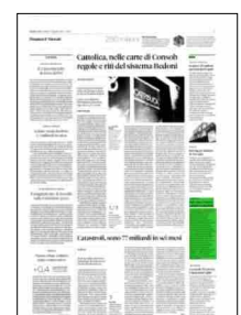
Superficie 3 %

ARTICOLO NON CEDIBILE AD ALTRI AD USO ESCLUSIVO DEL CLIENTE CHE LO RICEVE - 6640