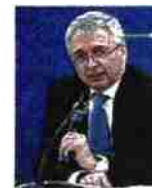
Il ministro dell'Economia e delle Finanze, Daniele Franco

ARTICOLO NON CEDIBILE AD ALTRI AD USO ESCLUSIVO DEL CLIENTE CHE LO RICEVE - 6640