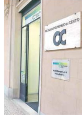
SEDE STORICA L'INGRESSO DI CARICENTO IN CORSO GUERCINO

ARTICOLO NON CEDIBILE AD ALTRI AD USO ESCLUSIVO DEL CLIENTE CHE LO RICEVE - 6640