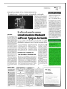
Superficie 7 %

ARTICOLO NON CEDIBILE AD ALTRI AD USO ESCLUSIVO DEL CLIENTE CHE LO RICEVE - 6640