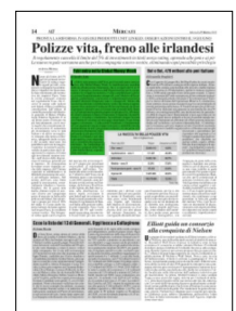
Superficie 14 %

ARTICOLO NON CEDIBILE AD ALTRI AD USO ESCLUSIVO DEL CLIENTE CHE LO RICEVE - 6640