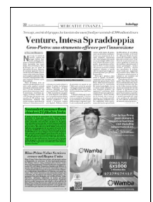
Superficie 8 %

ARTICOLO NON CEDIBILE AD ALTRI AD USO ESCLUSIVO DEL CLIENTE CHE LO RICEVE - L.1601 - T.1601