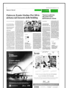
Superficie 1 %

ARTICOLO NON CEDIBILE AD ALTRI AD USO ESCLUSIVO DEL CLIENTE CHE LO RICEVE - L.1721 - T.1675