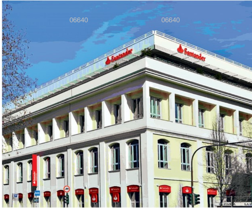
▲ Gli uffici La sede della banca Santander in corso Massimo d'Azeglio