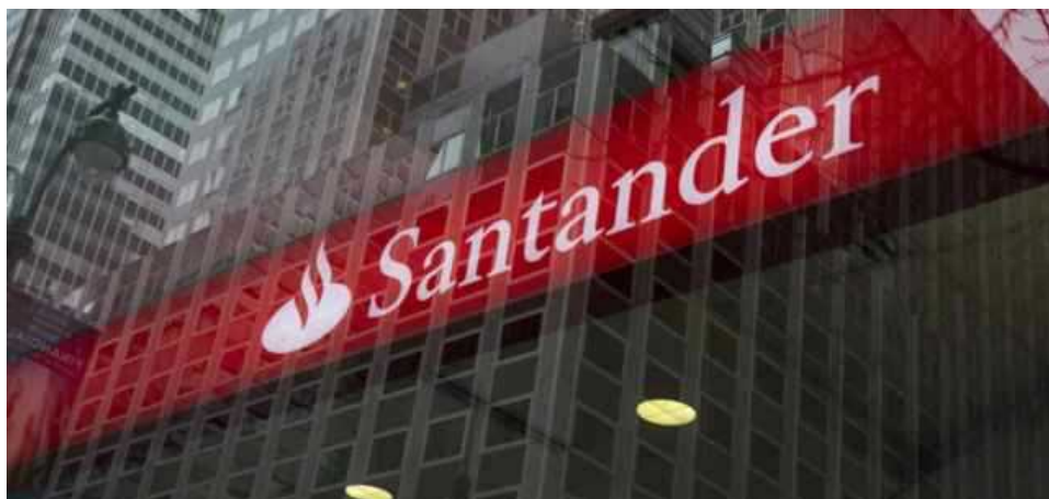
Santander Bank

Santander Consumer Bank chiuderà tutte le sue 21 filiali sul territorio nazionale. I dipendenti, come reso noto da Fisac Cgil e Fabi sono 738. Previsto un incontro per domani 14 settembre