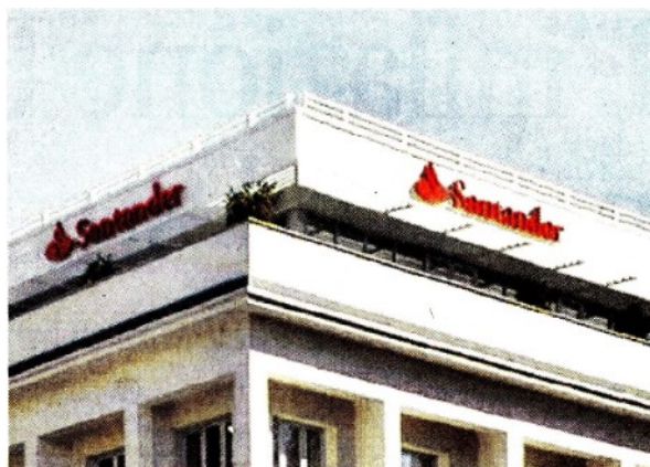
Una delle sedi del Santander

ARTICOLO NON CEDIBILE AD ALTRI AD USO ESCLUSIVO DEL CLIENTE CHE LO RICEVE - L.1747 - T.1675