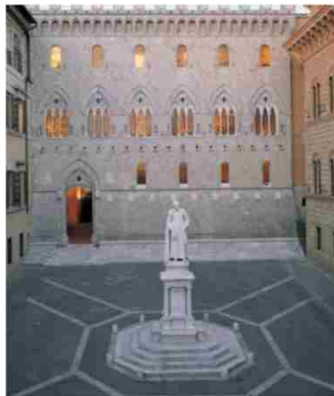
La storica sede del Monte Paschi di Siena, nella città toscana, la banca torna al centro di ipotesi di cessione delle quote da parte del Governo