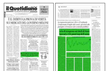
Superficie 56 %