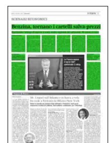
Superficie 26 %

ARTICOLO NON CEDIBILE AD ALTRI AD USO ESCLUSIVO DEL CLIENTE CHE LO RICEVE - L.1992 - T.1745