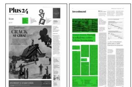
Superficie 40 %

L'emendamento al Dl aiuti, stabilisce ora che «in caso di concessione di prestiti si assume il 50 per cento della differenza tra l'importo degli interessi calcolato al tasso ufficiale di riferimento vigente alla