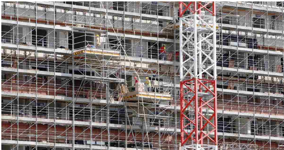
Mutui. Sotto esame le regole sui fringe benefit