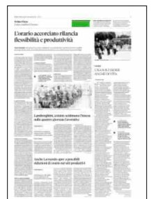
Superficie 1 %

ARTICOLO NON CEDIBILE AD ALTRI AD USO ESCLUSIVO DEL CLIENTE CHE LO RICEVE - L. 1992 - T. 1677